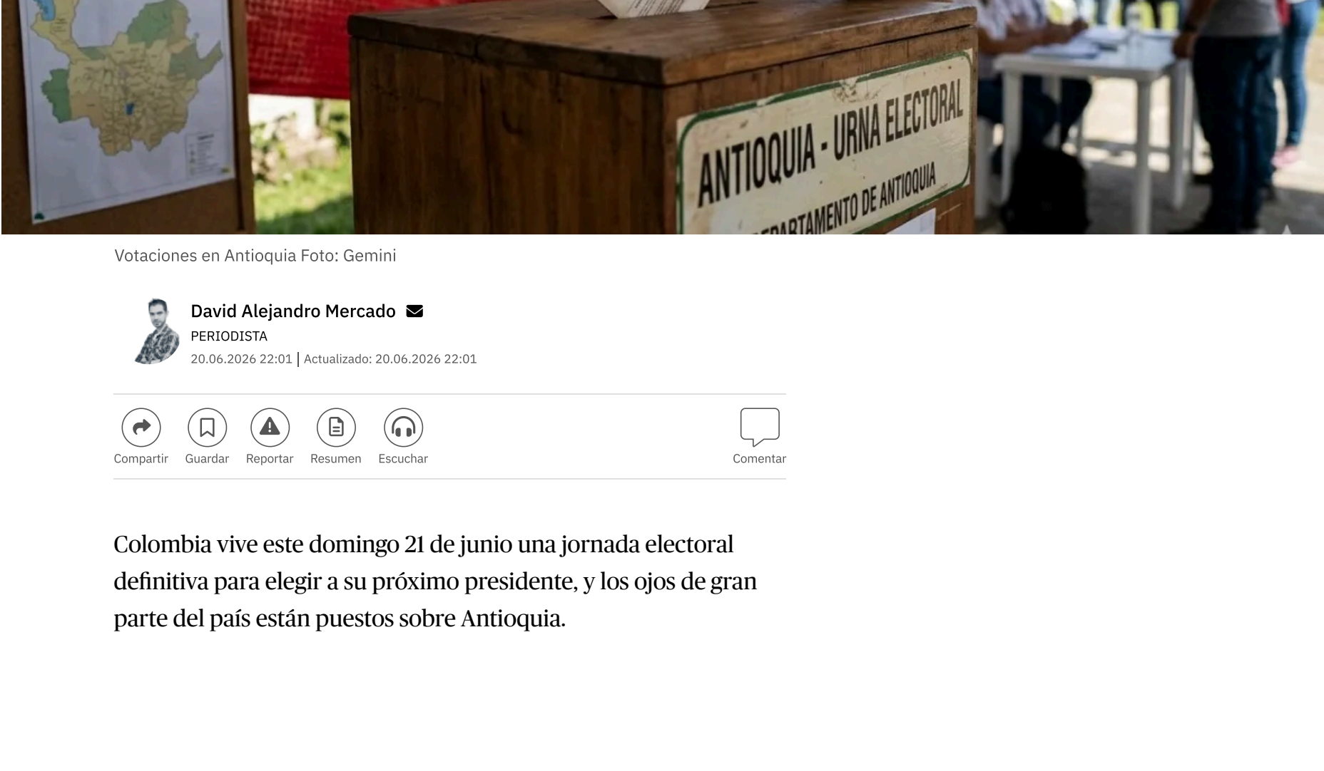
Votaciones en Antioquia

La región tiene uno de los mayores potenciales electorales del país, con más de 5 millones de personas habilitadas para ir a las urnas este domingo.