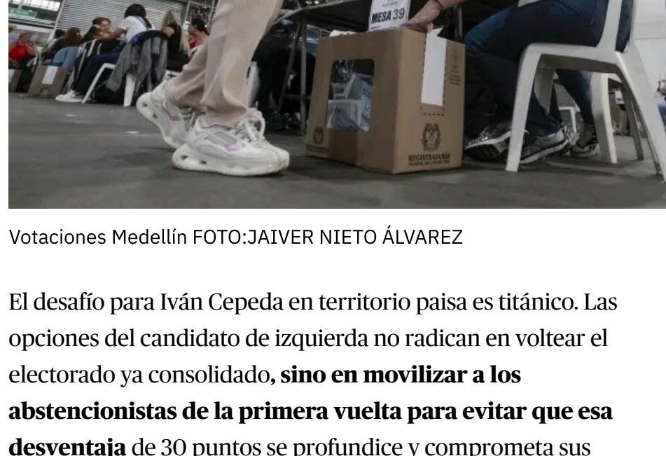
Votaciones Medellín