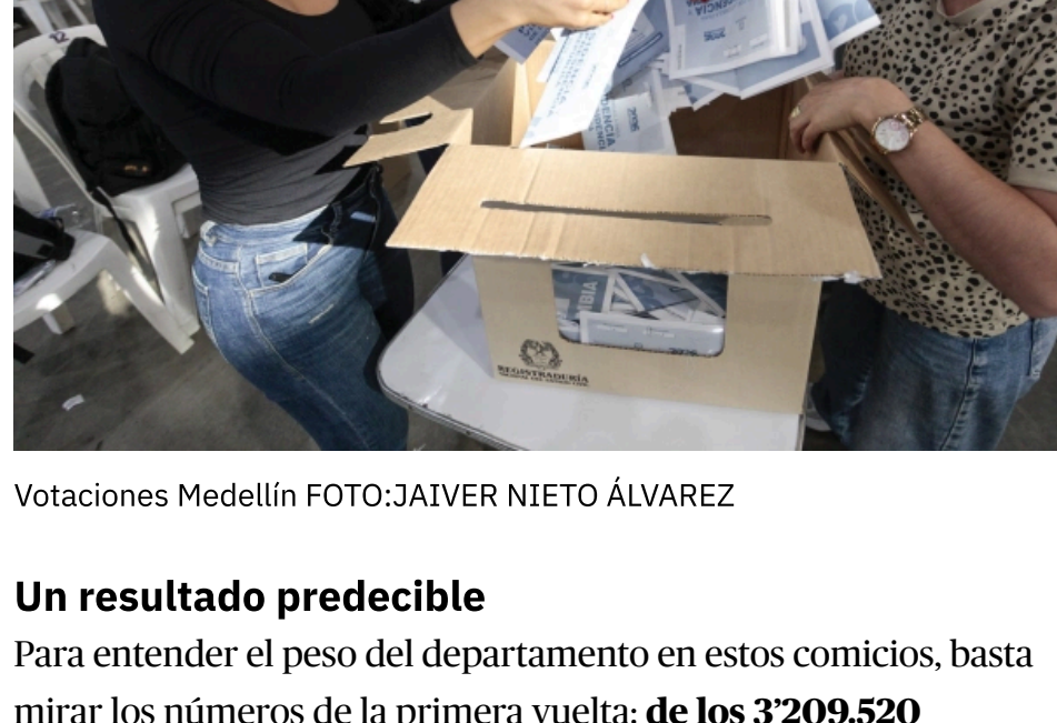
Votaciones Medellín

Colombia vive este domingo 21 de junio una jornada electoral definitiva para elegir a su próximo presidente, y los ojos de gran parte del país están puestos sobre Antioquia.