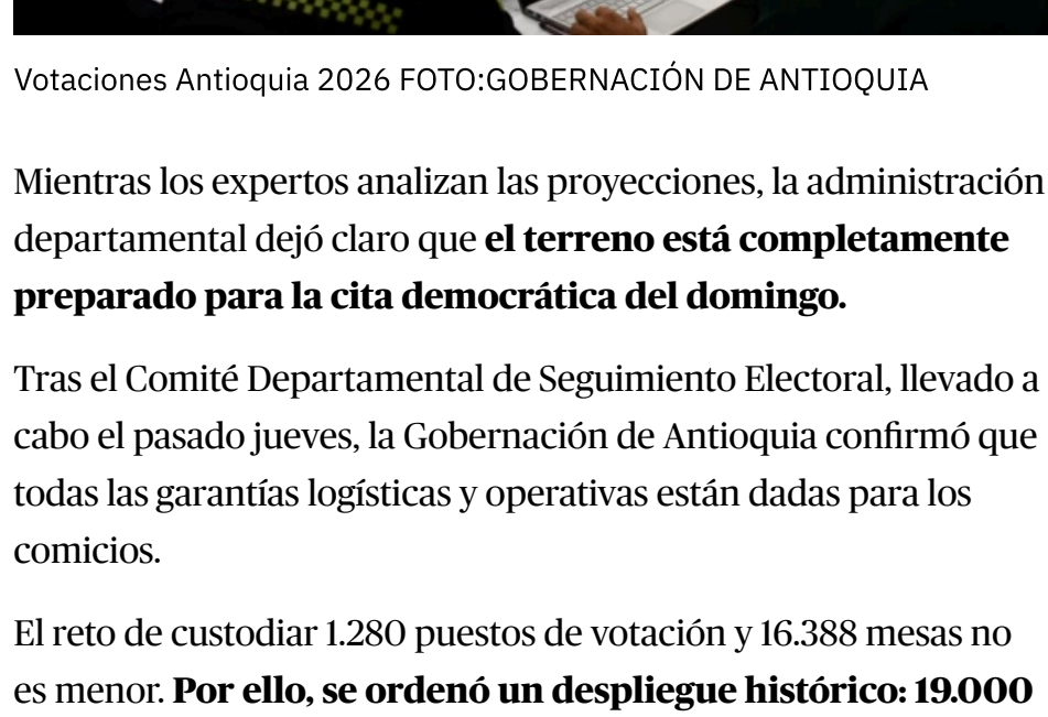
Votaciones Antioquia 2026

Mientras los expertos analizan las proyecciones, la administración departamental dejó claro que el terreno está completamente preparado para la cita democrática del domingo.